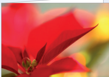
Best.-Nr. 4690 Christstern