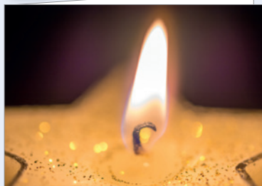
Best.-Nr. 4728 Sternkerze