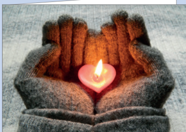
Best.-Nr. 4657 Lichtherz