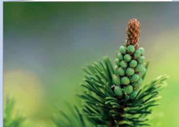
Best.-Nr. 4727 Tannengrün