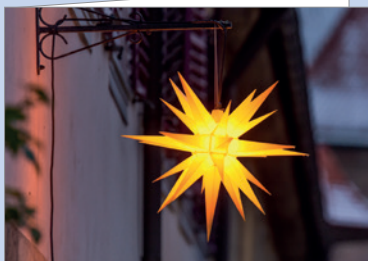
Best.-Nr. 4692 Sternenleuchten