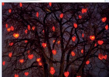
Best.-Nr. 4730 Wunderwunsch