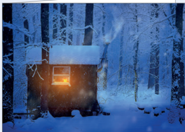
Best.-Nr. 4693 An Dezembertagen