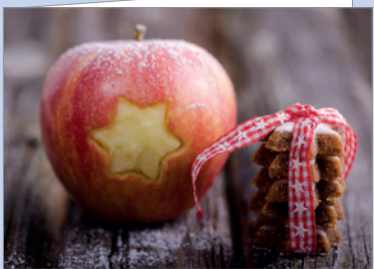
Best.-Nr. 4573 Weihnachtsapfel