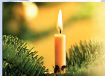
Best.-Nr. 4804 Christbaumkerze