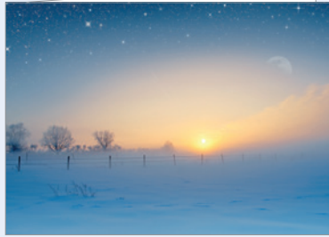
Best.-Nr. 4803 Winterlandschaft