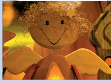
Best.-Nr. 4802 Weihnachtsengel