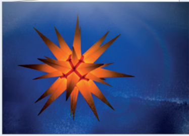
Best.-Nr. 4766 Erleuchtet