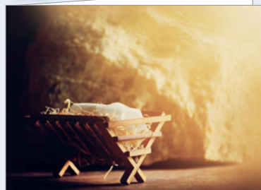
Best.-Nr. 4805 Weihnachtskrippe