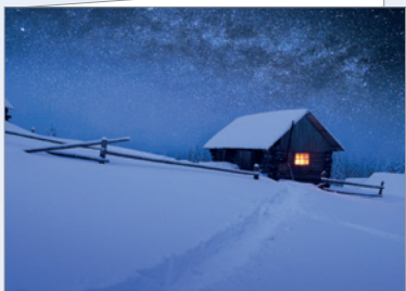
Best.-Nr. 4770 Stille Nacht