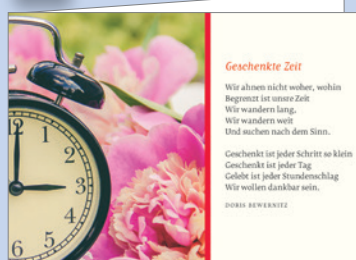
Best.-Nr. 2308 Zeitgeschenk