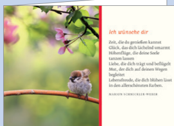
Best.-Nr. 2296 Höhenflug