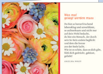
Best.-Nr. 2298 Unverblümt