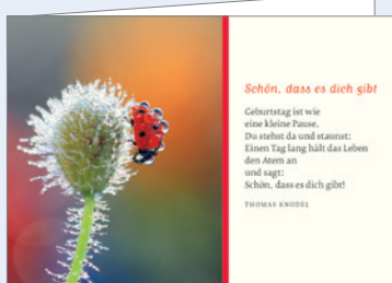
Best.-Nr. 2302 Glückskäfer