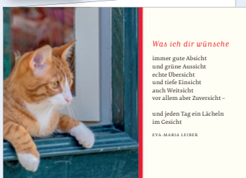
Best.-Nr. 2257 Gute Aussicht