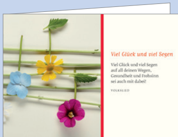
Best.-Nr. 2287 Blütenmelodie