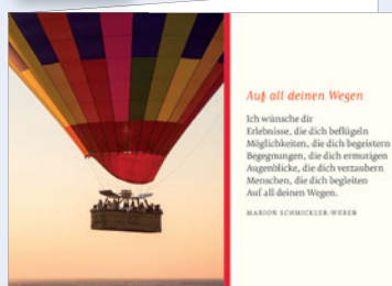
Best.-Nr. 2295 Ballonfahrt