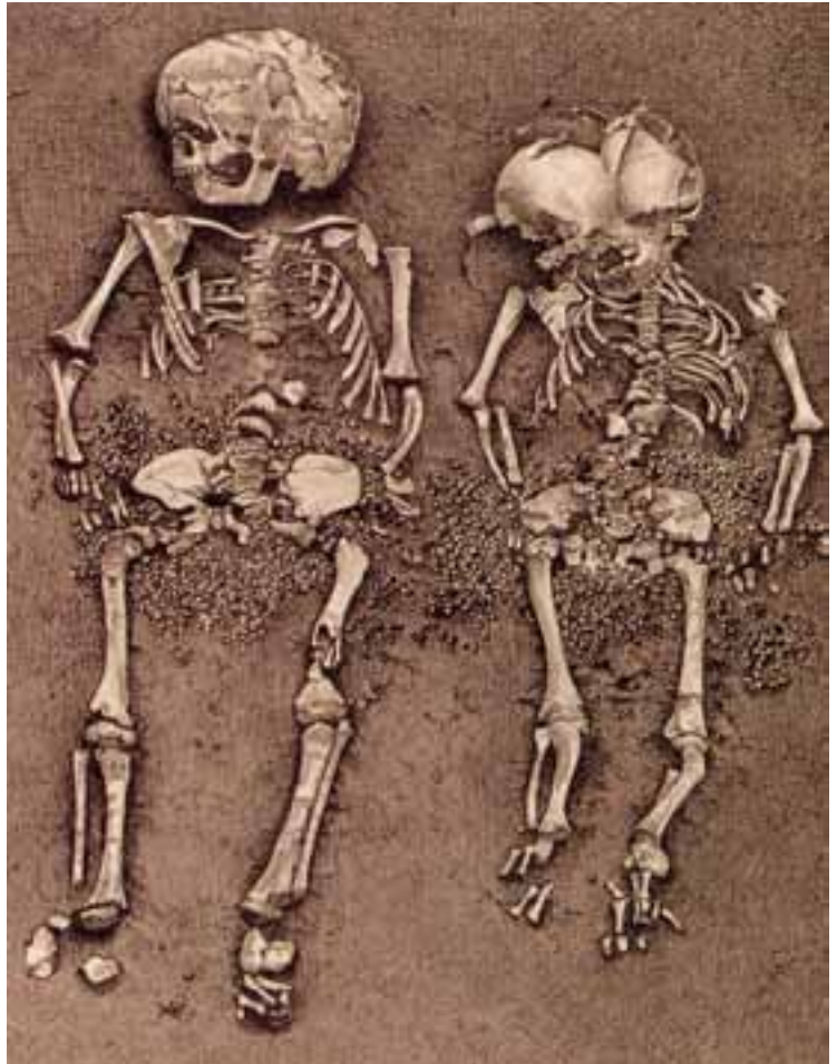
Ein reich geschmücktes Kindergrab, das bei Balzi Rossi in Italien freigelegt wurde. Der Schmuck aus durchbohrten Molluskschalen könnte frühes Beispiel eines erblichen sozialen Statussymbols sein.

Im aufkommenden magischen Bewusstsein versucht der Mensch, unabhängig von der Natur zu werden, sie zu bannen und zu beschwören. Damit beginnt zugleich der bis heute endlose Kampf um die Macht: Der Mensch wird zum Macher. Das zeigt sich zunächst im Verhältnis zum Tier: Er unterstellt das Tier seiner Macht, indem er es zeichnet oder malt. Die ersten Niederschläge dieses Strebens finden sich in den Höhlen der großen Jäger, deren Bilder vornehmlich einen bannenden, magischen Charakter haben. Ihre Zeit datiert zwischen 35 000 und 10 000 Jahren vor uns.