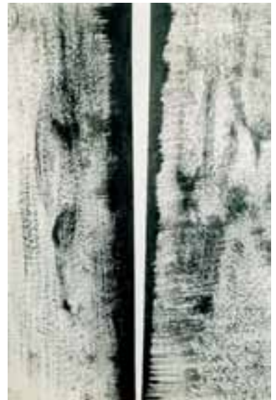
Barnett Newman (1905–1970), Untitled (The break) , 1946.