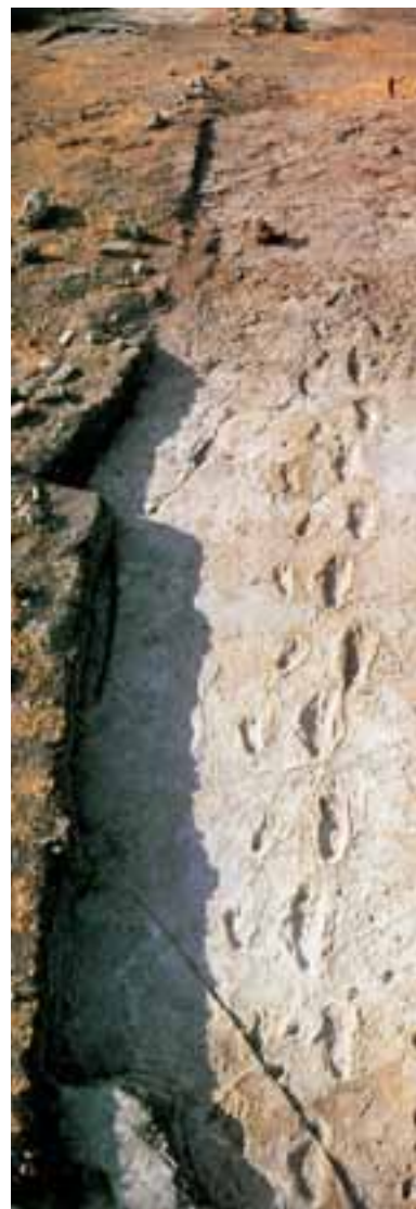
Bei Laetoli in Tanzania blieben in der Vulkanasche diese Fußabdrücke erhalten. Sie sind das früheste Zeugnis für eine zweifüßige Fortbewegung. Vor etwa 3,5 Millionen Jahren wanderten ein erwachsenes und ein kindliches Lebewesen durch den Ascheregen. Dabei trat das Kind in die Fußstapfen des Erwachsenen. Es kamen noch kleine Hirsche vorüber, und ein kurzer, heftiger Regen ergoss sich über die Landschaft, ehe die Fußspuren durch weitere Vulkanausbrüche zugedeckt wurden.

Die Wissenschaft der vergangenen Generationen hat ein Zerrbild des frühen Menschen entworfen: Seine intellektuellen Fähigkeiten seien nur gering gewesen. Er habe durchweg falsche Schlüsse über Ursache und Wirkung gezogen. Seine rituellen Praktiken – zauberische Mittel – würden das geringe geistige Niveau offenbaren, das an heutigen Primitiven immer noch studiert werden könne.