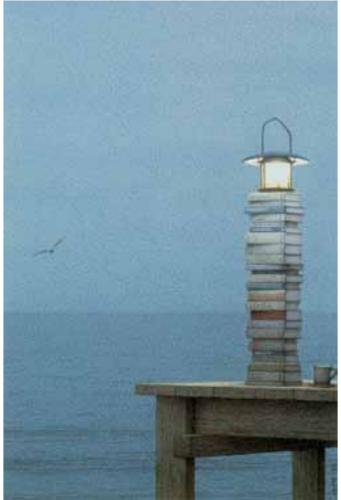
Quint Buchholz (geb. 1957), Der Leuchtturm.

Dieses Buch stellt sich der Aufgabe. Es spricht aus, was unter der Oberfläche virulent ist. Es nimmt an, dass die Zukunft nicht mehr mit Einzelkorrekturen, sondern nur mit einer alles umfassenden Neubesinnung gewonnen werden kann. Nicht Faktoren gesellschaftlicher Entwicklung stehen folglich im Vordergrund, sondern Fragen nach dem, was der christliche Glaube selbst zu der Entwicklung beigetragen hat und wie es um seine Erneuerungsressourcen bestellt ist.