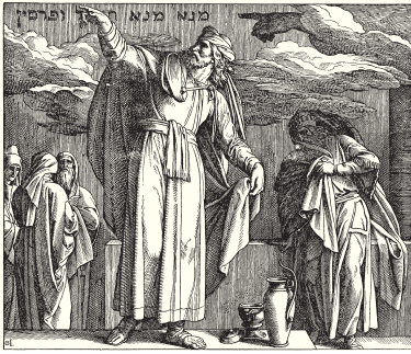
Julius Schnorr von Carolsfeld (1794–1872), Der Prophet Daniel (Dan 5) , 1860.