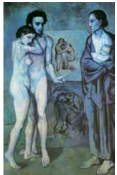
Pablo Picasso (1881–1973), La vie – Das Leben, 1903.