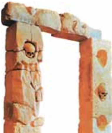
Keltische Kultstätte in Roquepertuse, 2. Jh. v. Chr.