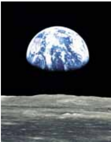
Der Planet Erde.