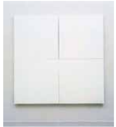
Robert Rauschenberg (1925–2008), White Painting, 1951.