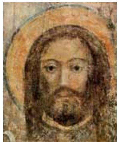
Christus. Gotische Wandmalerei im Dom zu Lübeck.