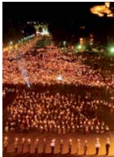
Lichterprozession in Lourdes.