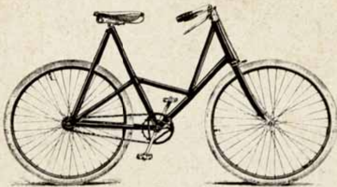
Fig. 12. Rahmen der Chinnocke Davis Cycle Co. Ltd.