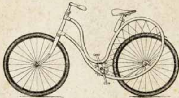
Fig. 3. Damenfahrrad von Harris.