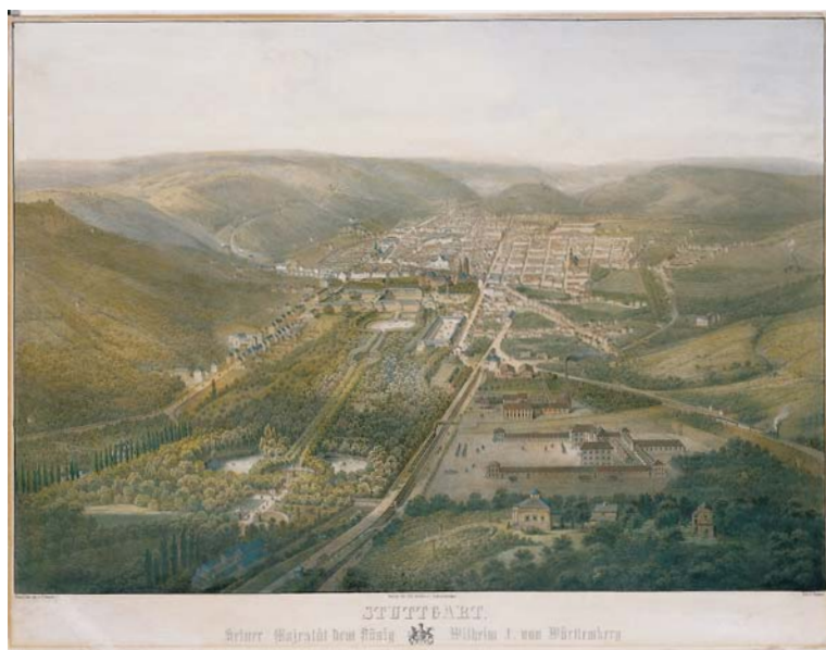
Stuttgart als königliche Residenzstadt 1852. Kolorierte Lithografie von Friedrich Wagner und Friedrich Federer.

Bis das königliche Stuttgart entstehen konnte, war es ein langer Weg. Herrschaft aber hat sich seit früher Zeit im heutigen Stadtgebiet manifestiert. Das wohl älteste Zeugnis hierfür ist das um 105 n. Chr. auf dem Hallschlag in Stein neu gebaute römische Reiterkastell (➔ Kap. 3). Es führte mit seiner Lage an einer Hangkante über dem Neckar die Herrschaft Roms mit den bis dato hierzulande völlig ungewöhnlichen, massiven Ringmauern und Türmen sinnfällig vor Augen.