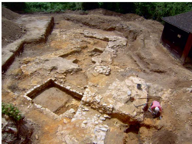
Grabungsfoto von der Altenburg mit der hochmittelalterlichen Burgmauer, die einen römischen Keller schneidet.

setzt war mit den Zeichen adeliger Macht: Burgen. Sie dienten als Sitz eines Herrschaftsträgers und seines Haushalts, als Mittelpunkt einer Grundherrschaft, Verteidigungsbauwerk und manchmal auch als Rechtsort. Im heutigen Stadtgebiet ist natürlich zuerst die Burg Wirtemberg auf dem jetzigen Rotenberg zu nennen, seit der 2. Hälfte des 11. Jh. frühes Herrschaftszentrum der Grafen. Sie wurde 1819 für den Bau der Grabkapelle abgebrochen. Daneben existierten noch an die 38 weitere Burgen auf Stuttgarter Gemarkung. Die meisten sind spurlos verschwunden. Als Burgstellen bis heute gut sichtbar sind noch