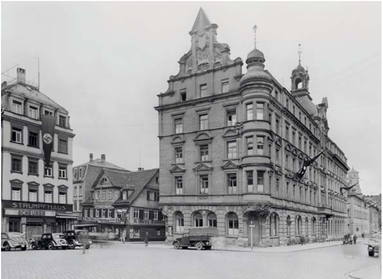
Das Hotel Silber mit Hakenkreuzfahnen, Aufnahme um 1935.

sehr bewusst von aller monarchischen Prachtentfaltung abzusetzen. Das spiegeln die heftig geführten Diskussionen um den Erhalt und Wiederaufbau des Neuen Schlosses wider, der schließlich mit nur knapper Mehrheit im Landtag 1956 beschlossen wurde.