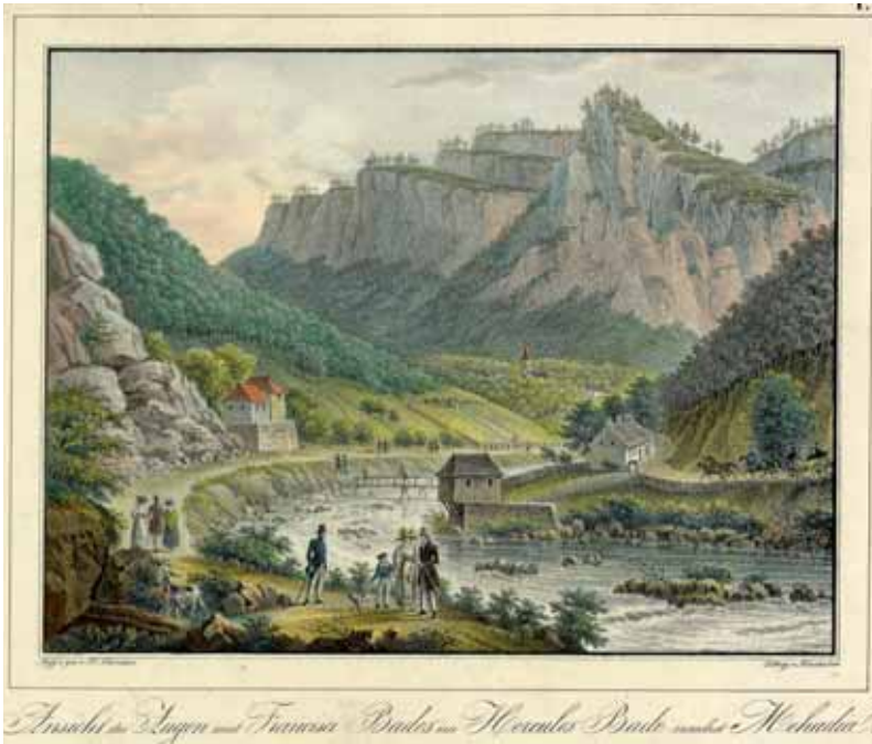
Abb. 1: Bäle Herculane (Herkulesbad), Augen- und Francisci-Bad, F. Neumann 19. Jh.

hören dazu die Vogesen, die Pyrenäen oder das Massif Central, in Polen ist es unter anderem Niederschlesien am Fuße der Sudeten, in Deutschland weisen Harz, Rhön, Eifel, Taunus, Schwarzwald und Weserbergland eine Vielzahl an Kurbädern auf. Zahlreiche Badeorte der ehemaligen k.u.k. Monarchie Österreich-Ungarn finden sich entlang des Karpatenbogens in Rumänien, Ungarn und der Slowakei. Die landschaftlich reizvolle Umgebung aller dieser am Rand von Gebirgen oder in Mittelgebirgen gelegenen Orte war nicht zuletzt ein wichtiger Faktor für die Entwicklung des Bädertourismus im 19. Jahrhundert.