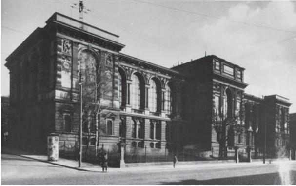
Die Württembergische Landesbibliothek 1922, 1970 und 2021