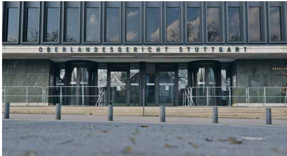
Das Oberlandesgericht Stuttgart

Am frühen Morgen des 15. November 2023 herrschen kalte Temperaturen. Um 8 Uhr stehen erste Journalist:innen am Eingang des Oberlandesgerichts Stuttgart . Gegen 9:30 Uhr ist eine Schlange aus Presse und interessierter Öffentlichkeit entstanden. Wer die Drehtür passiert, kommt in einen Kontrollraum mit Polizist:innen. Die Kontrollen sind streng: Man legt Handy, Notebook, Rucksack in eine Kiste und läuft, wie am Flughafen, durch einen Körperscanner. Anschließend wird der Körper abgetastet, auch die Schuhe werden überprüft. Allgemein gilt: Weder ein Kaugummi noch eine Flasche Wasser ist im Sitzungssaal erlaubt. Wer einen Presseausweis hat, darf ein Notebook oder einen Block und Stifte in den Saal nehmen.