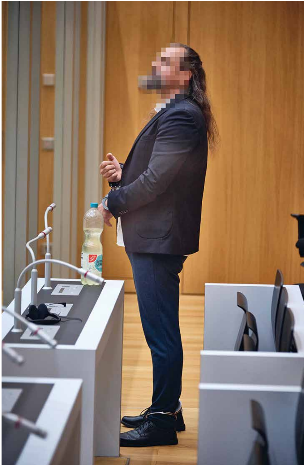
Ingo K.s Verurteilung am 15. November 2023